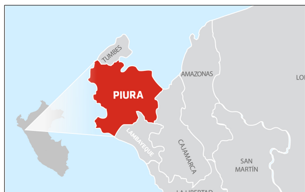
Ámbito geográfico de influencia: PIURA