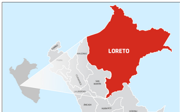
Ámbito geográfico de influencia: LORETO