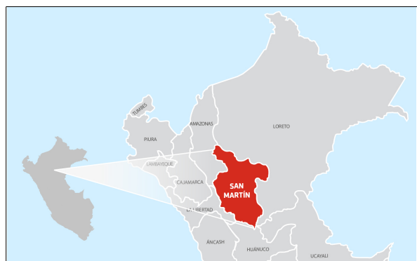
Ámbito geográfico de influencia: SAN MARTIN