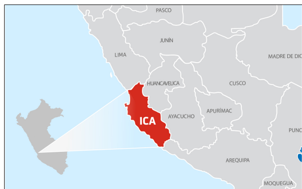
Ámbito geográfico de influencia: ICA